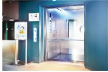
障害者向け館内エレベーター設置