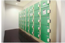
コインロッカー40台 100円リターン式(無料)