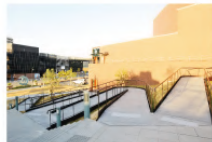
2Fの入口までは、階段以外にもスロープとエレベーターがごさいます。