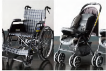
車いす10台常設 ベビーカーA型10台常設