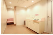
授乳室完備(男性立入禁止) ●おむつ替え台 ●パピーベッド完備 ※希望者にはミルク給湯あり