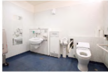
多目的トイレ ※金トイレ簡所(5カ所)に設置 ●大人用ベッド設置(B1/1カ所、2F/2カ所) ●オストメイト対応(B1/1カ所、1F/1カ所、2F/1カ所)