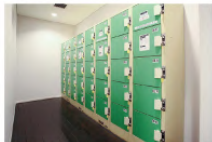
コインロッカー40台 100円リターン式(無料)