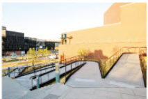
2Fの入口までは、階段以外にもスロープとエレベーターがご用意です。