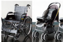
車いす10台常設 ベビーカーA型10台常設