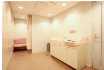
授乳室完備(男性立入禁止) ●おむつ替え台 ●ベビーベッド完備 ※希望者にはミルク給湯あり