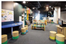
キッズコーナー 水の生き物を調べるための本や資料を多数の用意。コンピュータを使ったフグ、ウニ、クジラのQ&Aなども人気。