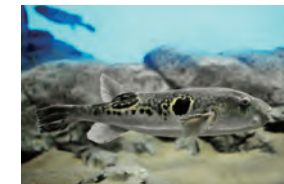
フグの仲間たち 世界中のフグの仲間たち100種類を常時展示しています。