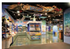
ミュージアムショップ