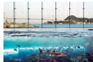
関門海峡潮流水槽(上部) 背景一面に関門海峡が広がるこの水槽では実際の海の中をのぞいているような不思議な世界へみなさんをいざないます。