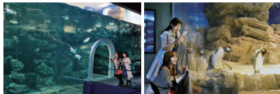
ペンギン村:亜南極ゾーン 水深6m、水量約700トン。ペンギンプールとしては世界最大級です。水中トンネルからは、飛ぶように泳ぐペンギンを見ることができます。