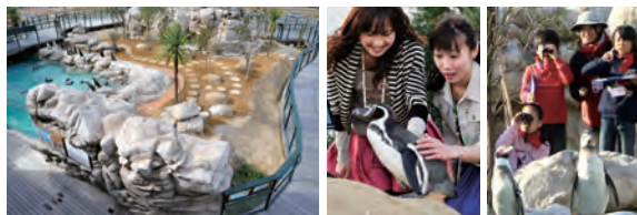
ペンギン村:温帯ゾーン 木道を歩いて回遊するかたちで観察できます。野生地での調査活動の模擬体験や、ペンギンとの記念撮影、ペンギンタッチ、エサやりなどができます(人数制限あり)。

チリ国立サンチャゴ・メトロポリタン公園より「生息域外重要繁殖地」の指定を受けています!! 海響館とチリ国立サンチャゴ・メトロポリタン公園は、互いに協力し、フンボルトペンギン特別保護区で得られた飼育技術などがチリでのフンボルトペンギン飼育下繁殖を支援し、野生地での研究と保全に貢献していくことを約束する国際協定に調印しました。