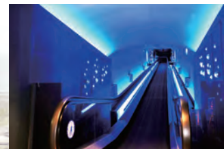
スローペースエレベーターで4Fへ スローペースエレベーターに乗るとそこはもう海の世界。音と映像がより臨場感を表現します。4階に進み、関門海峡のパノラマ水槽からご覧いただけます。